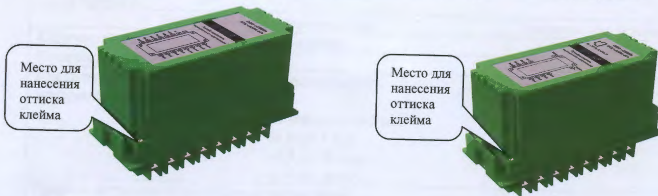
а) преобразователь с аналоговым выходом;

Внешний вид измерительных преобразователей АУРА представлен на рисунке 3.